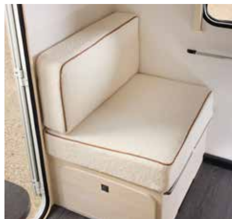
Stof Cloud (Tegen betaling)