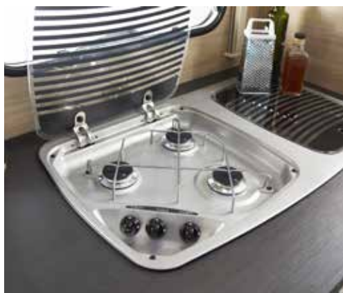
3-pits kooktoestel en spoelbak uit rvs met glazen afdek