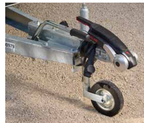
AKS - Stabilisator 3004