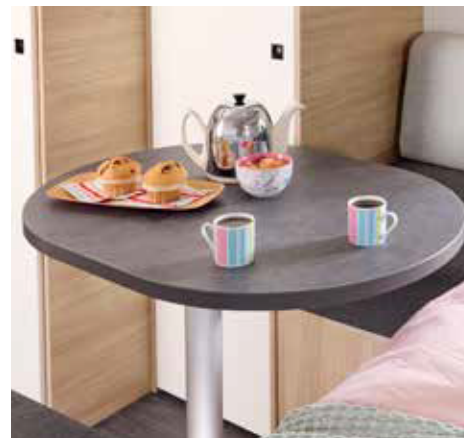
EASY 350CP tafel