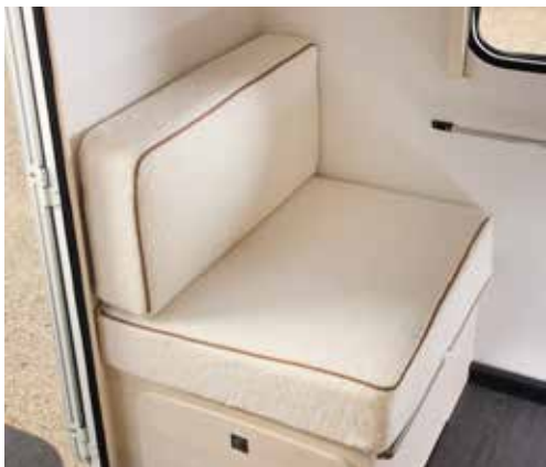
Stoffering Cloud (optie)