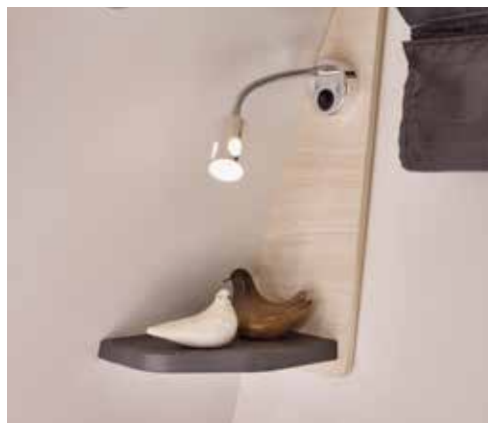
LED leesspotje met USB-aansluiting