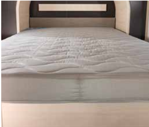
Matrasdikte 15 cm (Premium)