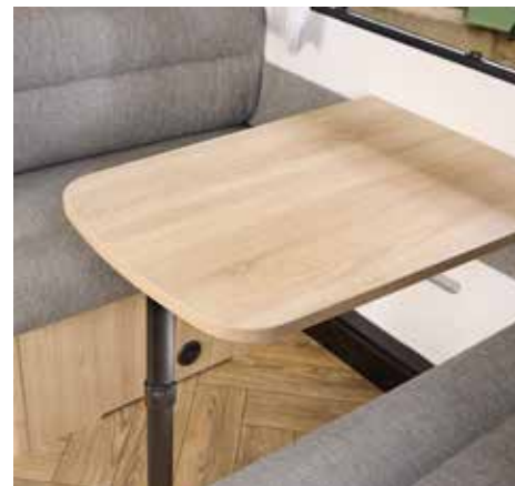
SPORT EDITION Houten Tafel